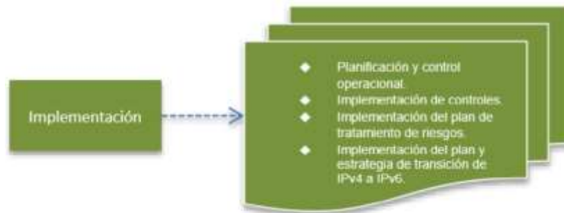
Figura 4. Fase de implementación modelo de seguridad

Objetivo: Llevar acabo la implementación de la fase de planificación del SGSI, teniendo en cuenta para esto los aspectos más relevantes en los procesos de implementación del Sistema de Gestión de Seguridad de la Información de la entidad.