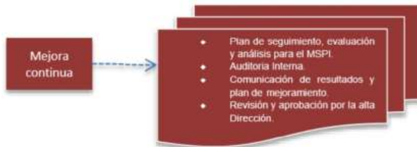
Figura 5. Fase Evaluación Desempeño modelo de seguridad

Objetivo: Evaluar el desempeño y la eficacia del SGSI, a través de instrumentos que permita determinar la efectividad de la implantación del SGSI.