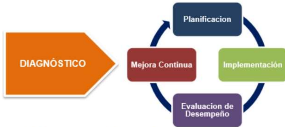
Figura 1. Ciclo de operación Modelo de Seguridad y Privacidad de la Información