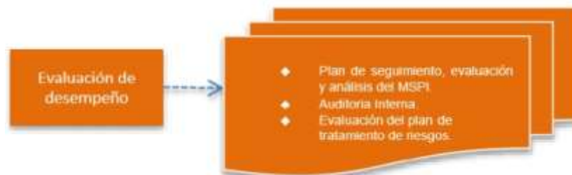
Figura 6. Fase Mejora Continua modelo de seguridad

Objetivo: Consolidar los resultados obtenidos del componente de evaluación de desempeño, para diseñar el plan de mejoramiento continuo de seguridad y privacidad de la información, que permita realizar el plan de implementación de las acciones correctivas identificadas para el SGSI.