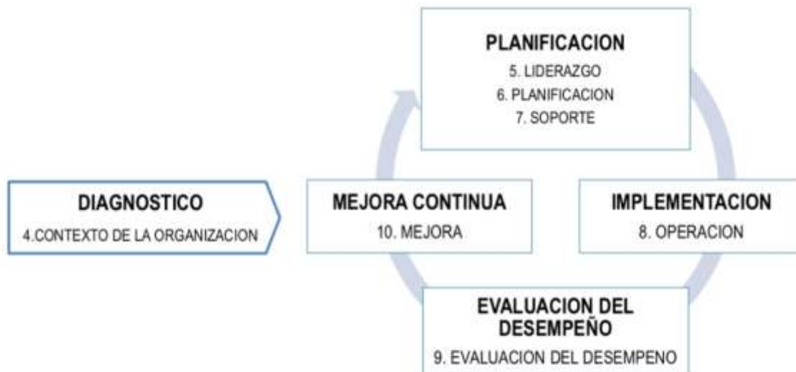
Figura 2. Norma ISO 27001:2003 alineado al Ciclo de mejora continua